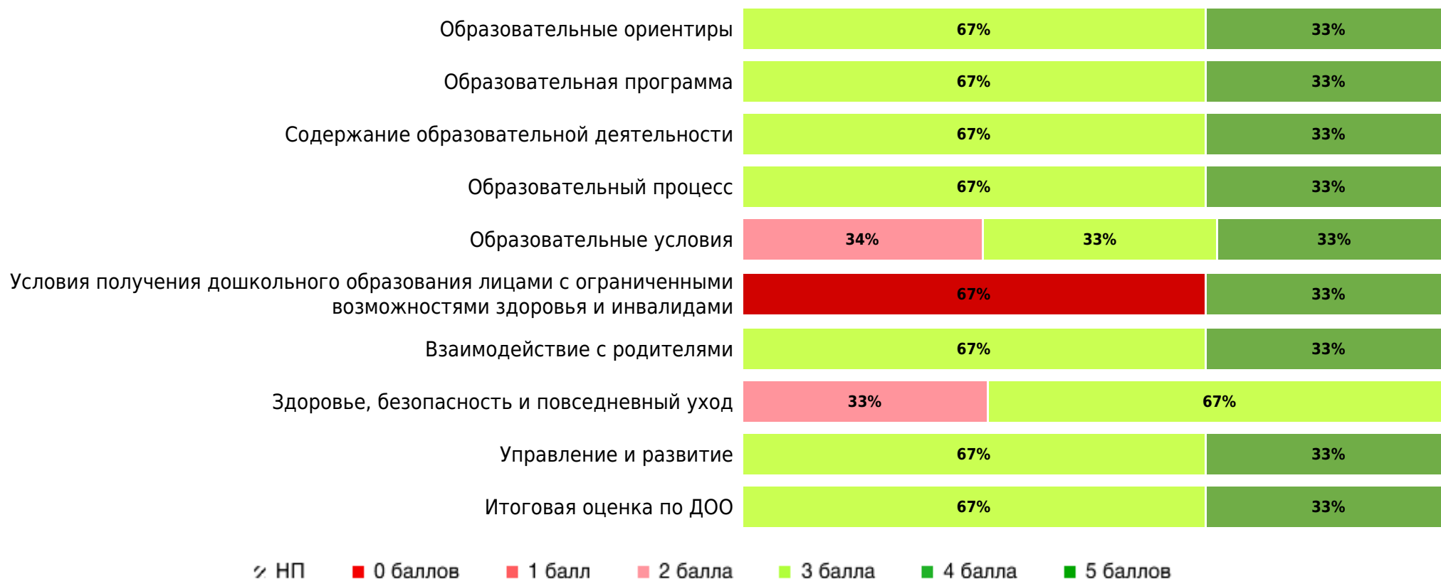
Доли ДОО с разными баллами (внутренняя оценка)

В процессе самооценки по шкалам МКДО было оценено 8 групп(ы) ДОО из 3 ДОО субъекта РФ. Результаты внутренней оценки качества образования в ДОО субъекта РФ по областям качества (по 5- балльной шкале):