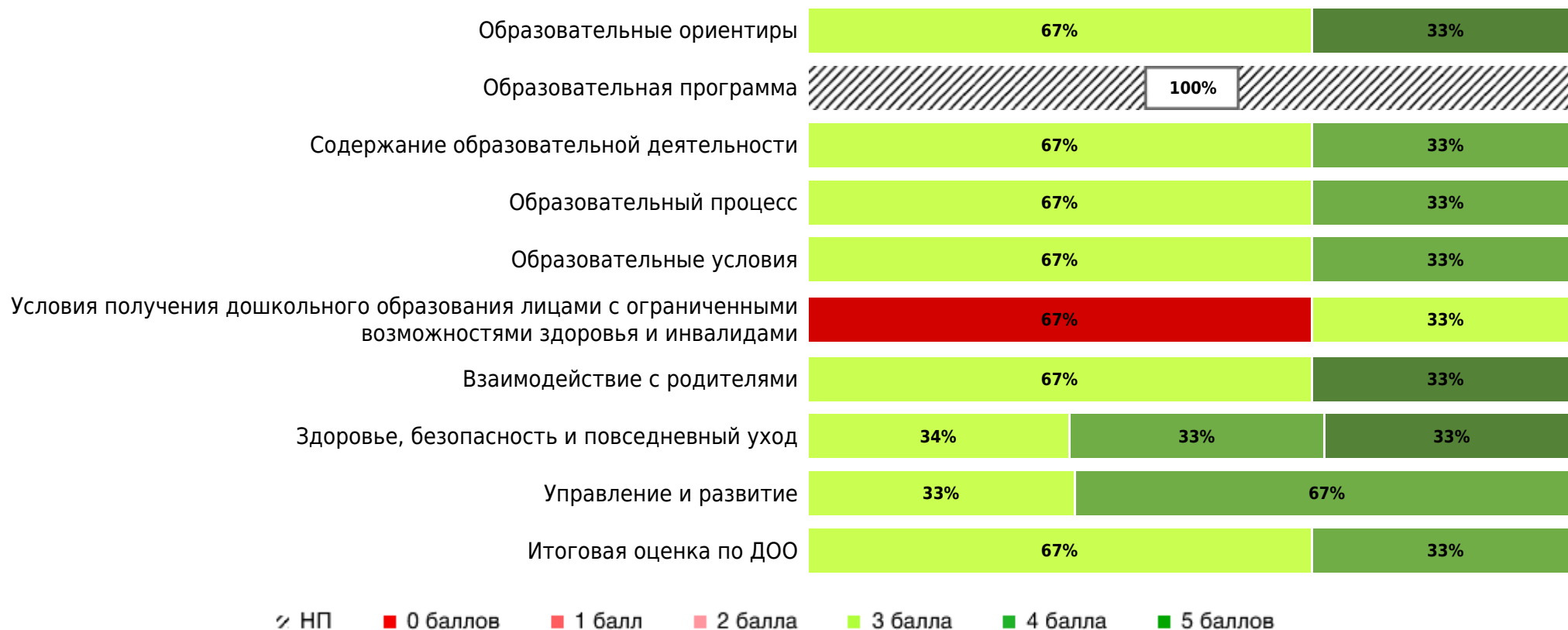
Доли ДОО с разными баллами у их ООП ДО ДОО (самооценка)

В процессе самооценки было оценено 4 ООП ДО ДОО из 3 ДОО субъекта РФ.